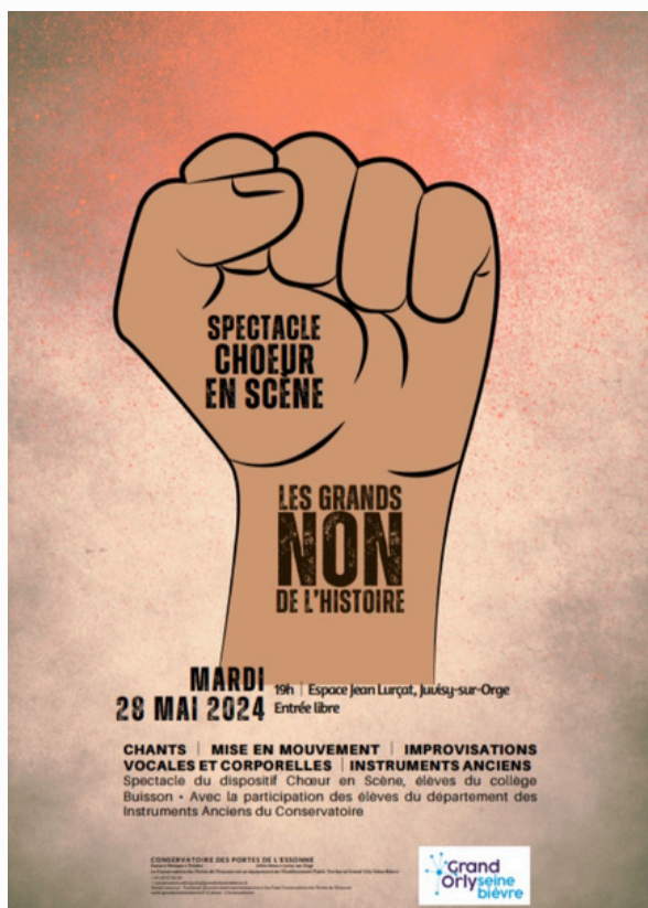
Affiche de cette année

Le spectacle se déroulera le 28 Mai 2024